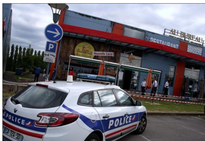
Hier, un cordon de sécurité a été tendu autour du bâtiment abîmé.