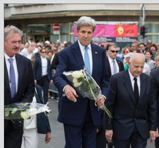
Un rassemblement a été organisé ce samedi vers 14 h place de la Constitution à Luxembourg afin de rendre hommage aux victimes de l'attentat qui a frappé la ville de Nice jeudi. En visite au Luxembourg ce samedi, le secrétaire d'Etat américain John Kerry a également déposé une gerbe de roses blanches au pied du monument vers 15 h 15.