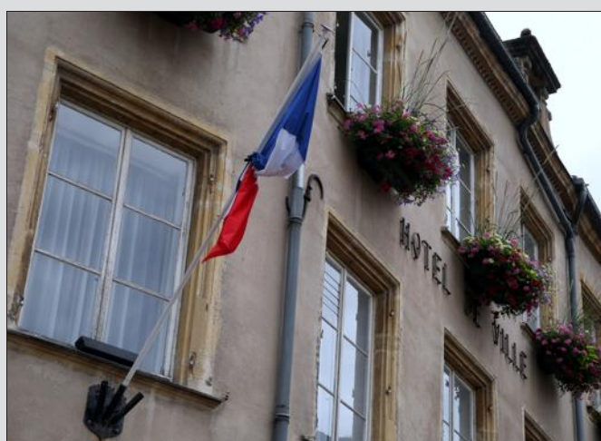
En mémoire des victimes de Nice, une minute de silence sera observée lundi à 12 h dans plusieurs lieux publics, notamment sur le parvis de la mairie de Thionville.