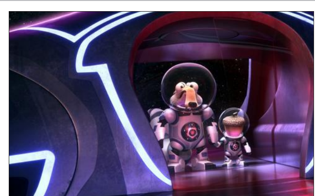
L'âge de glace 5, à Kinopolis.

Kinopolis ALICE DE L'AUTRE CÔTÉ DU MIROIR : 2D, 10 h 55, 17 h 45, 20 h 15, 22 h 40. ANGRY BIRDS : 2D, 10 h 50, 13 h 50, 16 h 40, 18 h 40, 20 h 15, 22 h 40. BASTILLE DAY : 13 h 50, 16 h 40, 18 h 40, 20 h 15, 22 h 40. CAMPING 3 : 2D, 11 h 50, 13 h 40, 16 h 40, 18 h 40, 19 h 50, 22 h 35. CONJURING 2 : LE CAS ENFELD : 2D, 16 h 50, 19 h 40, 20 h 30. DÉBARQUEMENT IMMÉDIAT : 2D, 13 h 50, 17 h 45, 19 h 05, 20 h 30, 22 h 35. L'ÂGE DE GLACE 5 - LES LOIS DE L'UNIVERS : 2D, jeu, ven, sam, lun, mar ; dim : 10 h 50, 14 h, 15 h 55, 20 h. L'ÂGE DE GLACE - LES LOIS DE L'UNIVERS : 3D, 18 h 15, 22 h 15. L'AIGLE ET L'ENFANT : 2D, 14 h 05. LE LIVRE DE LA JUNGLE : 2D, 10 h 55. LE MONDE DE DORY : 2D, 10 h 45, 13 h 55, 16 h, 20 h 20, 22 h 15. NINJA TURTLES : 2D, 14 h ; 16 h 30, 19 h 45, 22 h 35. NOS PIRÉS VOISINS 2 : 2D, 13 h 40, 15 h 50, 19 h 55, 22 h 20. DE RETOUR CHEZ MA MÈRE : 2D, 18 h 10. TARZAN : 2D, 10 h 50, 14 h 10, 20 h 20. TARZAN : 3D, 16 h 45, 22 h 25. 50, route d'Arlon Thionville (Tél. 03 82 54 88 00). La Scala 63 Boulevard Foch, Thionville (Tél. 03 82 82 25 34). Fermeture estivale du 6 juillet au 23 août. Le Grand Écran TOUT DE SUITE