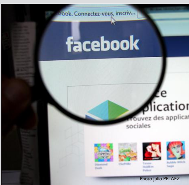
Vous êtes désormais plus de 13 900 à avoir "aimé" la page facebook "Le Républicain Lorrain édition de Moselle Nord". Si vous ne l'avez pas encore fait, rejoignez cette communauté. Vous pourrez ainsi suivre toute l'actualité du nord mosellan.