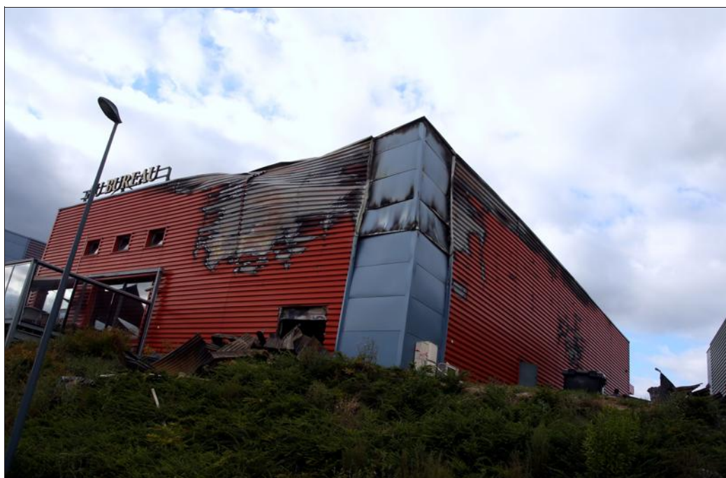
Une partie de la toiture a brûlé ainsi que les murs du bâtiment sur le côté où se trouve le restaurant La Ferme, mitoyen de son voisin Au Bureau.

Jeunesse Maelström disponible au format papier sur http://bit.ly/JMpapier et version kindle sur le site Amazon : http://bit.ly/JMkindle